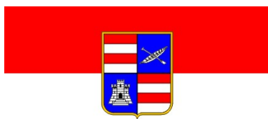
Dubrovačko- neretvanska županija